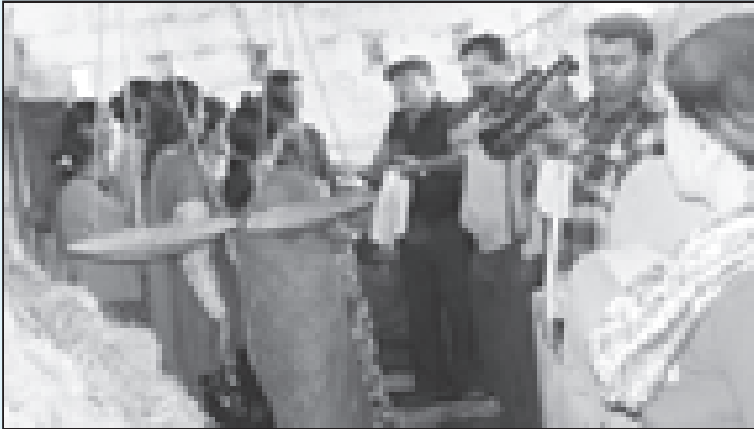
प्रशिक्षणको क्रममा श्रोतव्यक्ति विषयगत जानकारी प्रस्तुत गर्दै