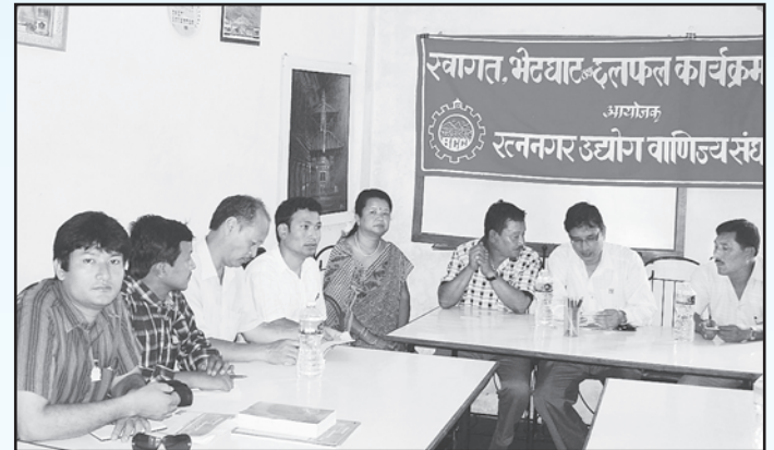
रत्ननगरमा भ्रमण टोली र स्थानीय उद्यमी व्यवसायीबीच अन्तरक्रिया हुँदै