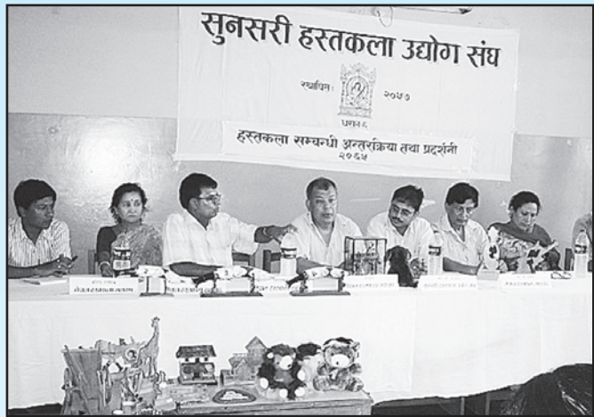
महासंघका अध्यक्षयू सुनसरीमा स्थानीय उद्यमी व्यवसायीहरूसँग भएको अन्तरक्रियामा भ्रमणको उद्देश्य र महासंघको बारे प्रकाश पार्नुहुँदै

विभिन्न जिल्लाहरूको स्थलगत अवलोकन भ्रमणबाट महासंघ र स्थानीय हस्तकला एवं उद्योग वाणिज्य संघहरूबीच राम्रो सम्बन्ध विकासमा टेवा पुग्ने र स्थानीय हस्तकलाको वस्तुस्थिति सम्बन्धी जानकारी प्राप्त भई आपसी संजाल विकास गरी आउने दिनमा अधिराज्यभरी नै हस्तकलाको प्रवर्द्धनमा सहज सहयोग पुग्ने अपेक्षा गरिएको छ ।