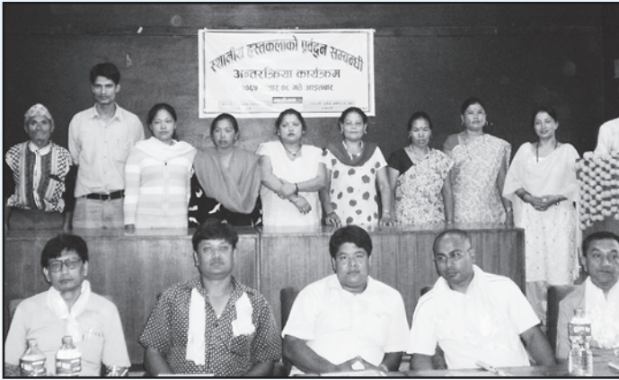
भ्रमण टोली र स्थानीय हस्तकला उद्यमी व्यवसायीबीच अन्तरक्रिया हुँदै

उक्त अवसरमा भ्रमणटोलीद्वारा बाग्लुङ्ग उद्योग वाणिज्य संघ, म्याग्दी उद्योग वाणिज्य संघ र तनहुँ उद्योग वाणिज्य संघका पदाधिकारी, कार्यसमिति सदस्य एवं स्थानीय हस्तकला उद्यमी व्यवसायीहरूको उपस्थितिमा अन्तरक्रिया गरी तहाँको स्थानीय हस्तकलाको वस्तुस्थितिबारे जानकारी हासिल गरिएको थियो । उक्त अवसरमा तहाँको स्थानीय