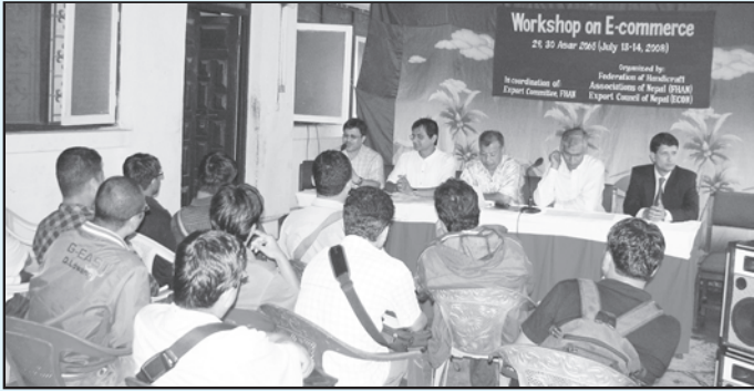
ई-कमर्स सम्बन्धी कार्यक्रमको फोटो भ्रमक

विद्युतिय संचार माध्यमको विकास तथा प्रयोगबाट आज विश्वका हरेक मुलुक, बजार, संघ संस्था तथा व्यक्तिहरुलाई एक आपसमा धेरै नजिक्याएको छ। इन्टरनेट, ई-मेल, वेबसाइटको विकास एवं व्यवस्थाले गर्दा विश्वका कुनै पनि संस्थाको बारे जानकारी हासिल गर्न, आपसमा पत्राचार एवं सूचना आदान प्रदान गर्न छिटो छरितो एवं सहज तुल्याउनुका साथै व्यापार तथा निकासी प्रबर्द्धन गर्न ठूलो सहयोग पुऱ्याएको छ। यस क्रममा विश्वमा व्यापार एवं वाणिज्य गतिविधिहरु विद्युतीय माध्यमबाट व्यवस्थित रुपमा संचालन गर्न ई-कमर्स प्रणाली शुरु भईसकेको छ। यस सन्दर्भमा महासंघका सदस्य एवं हस्तकला व्यवसायमा संलग्न उद्यमी तथा निकासीकर्ताहरुलाई ई-कमर्सको महत्व, प्रक्रिया, प्रयोग एवं यस सम्बन्धी विविध जानकारी गराउने उद्देश्यले यस महासंघ र नेपाल निर्यात परिषदको संयुक्त आयोजना एवं महासंघको निर्यात समितिको संयोजनमा २०६५ आषाढ २९ र ३० गते ललितपुरमा ई-कमर्स सम्बन्धी दुई दिने गोष्ठी आयोजना गरियो।