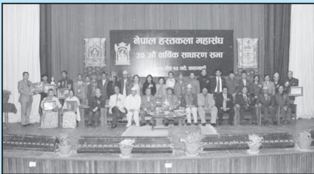
महासंघको ३०औं वार्षिक साधारण सभामा सम्मानित निकासीकर्ता उद्यमी कलाकारको सामूहिक फोटो भ्रमक