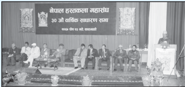
अध्यक्षज्यू महासंघको ३०औं वार्षिक साधारण सभामा स्वागत मन्तव्य दिनुहुँदै