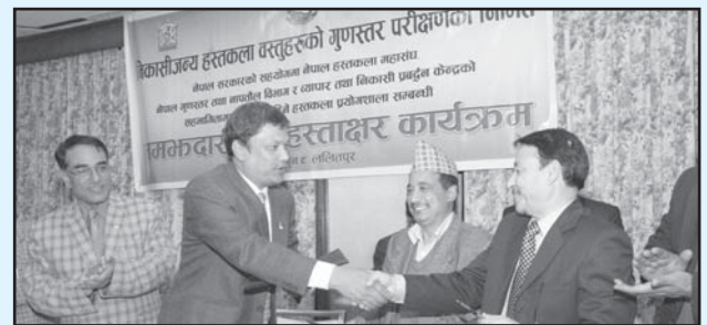
हस्तकला प्रयोगशाला स्थापना सम्बन्धी समझदारी पत्र आदान प्रदानको भ्रमक