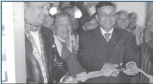
महासंघका अध्यक्ष र नेपाल निर्यात परिषद्का अध्यक्षबाट संयुक्त रूपमा Export Cell को शुभारम्भ गर्नुहुँदै

नेपालबाट अत्यधिक निकासी हुने वस्तुहरूमा हस्तकलाको महत्वपूर्ण स्थान रहँदै आएको छ। नेपालबाट वार्षिक ३ अरब भन्दा बढी हस्तकलाका वस्तुहरू विश्वका ८० भन्दा बढी देशहरूमा निकासी हुँदै आएको छ। हस्तकलाको निकासी सहजीकरण एवं निकासी प्रवर्द्धनका लागि विद्यमान समस्याहरूको पहिचान हुनु, समाधान हुनुका साथै समय सापेक्ष नीति नियमको तर्जुमा हुनु आवश्यक पर्दछ।