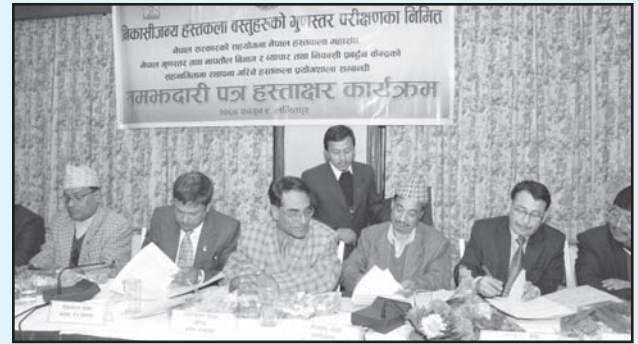
सम्बद्ध निकायका प्रमुखहरू प्रयोगशाला स्थापना सम्बन्धी समझदारी पत्रमा हस्ताक्षर गर्नु हुँदै