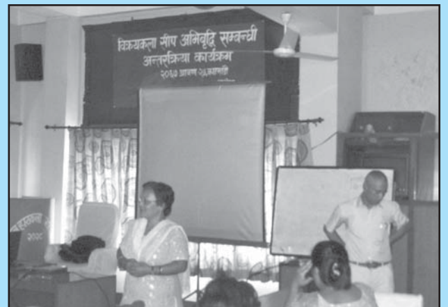
समितिकी संयोजकबाट कार्यक्रमको उद्देश्यबारे प्रकाश पार्नु हुँदै

साथै सहभागीहरूले भविष्यमा पनि सम्बन्धित व्यवसायीहरूका लागि समयसापेक्ष विक्रीकला सीप सम्बन्धी जानकारीमूलक कार्यक्रम गर्दै जानुपर्ने सुझाव दिइएको थियो ।